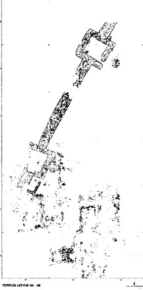
Plan 1: Savunma sistemi ve yerleşim planı

açılan surun belli aralıklarla inşa edildiği anlaşılan kule yapıları, 6.35 m boyutlarındadır (Plan1).