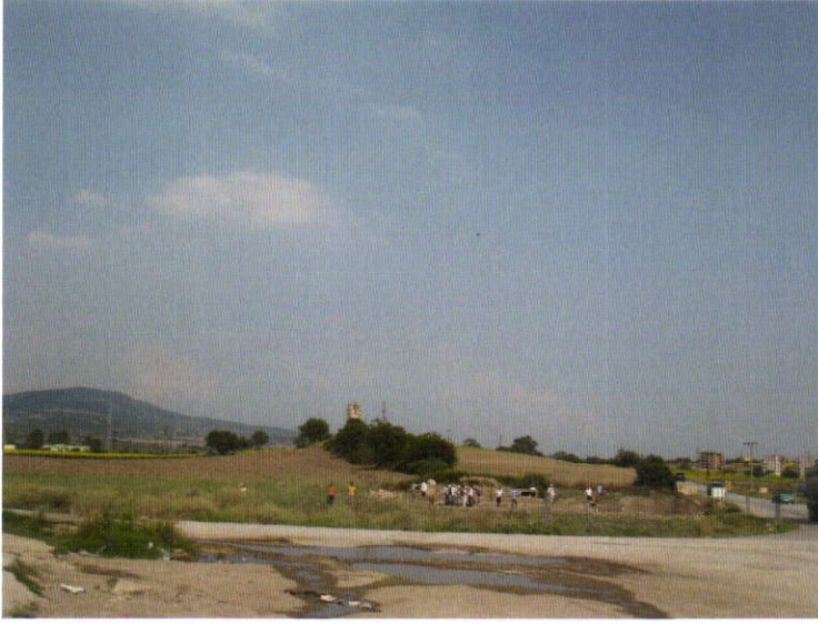
Su Terazisi Nekropolisi Batıdan

Yapılan çalışmalar sonucunda altı aşmada tespit edilen; Arkaik, Klasik, Helenistik, Roma ve Bizans dönemlerine tarihlenen mezar sayısı 64' tür. Bunlar genellikle pişmiş toprak lahitler ile çatı kiremitlerden oluşmaktadır.