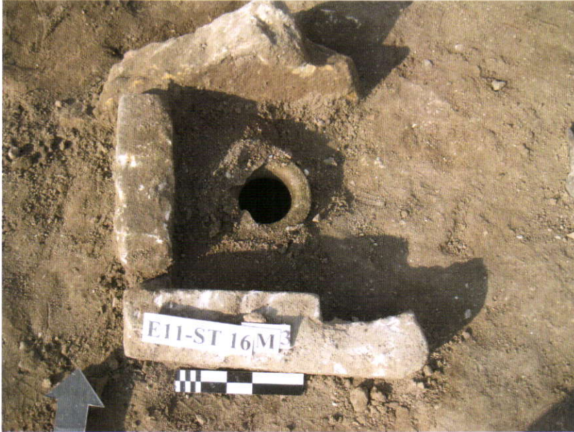
Urne mezar. Urnenin etrafı yassı taşlarla korunmuştur.